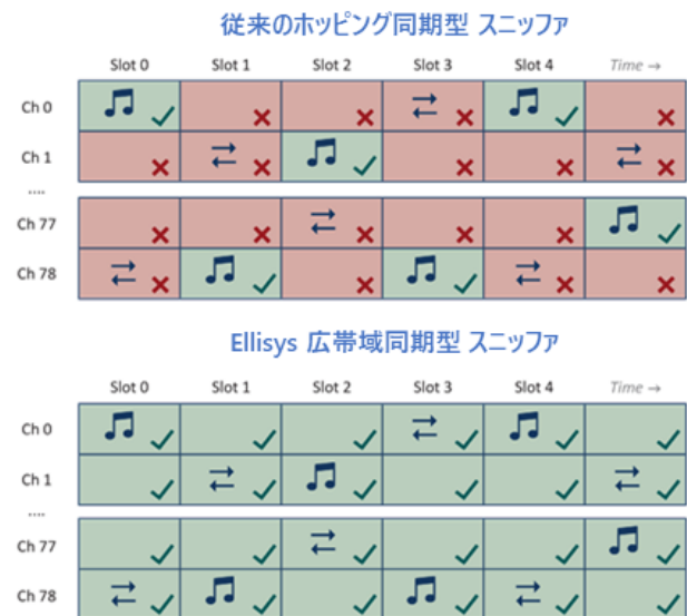
図1 従来のホッピング同期 vs. 広帯域同期

このような高度な技術は、標準的なBluetooth無線チップでは実現できません。いくつかのチャンネルだけでなく、すべてのチャンネルを同時に記録します。